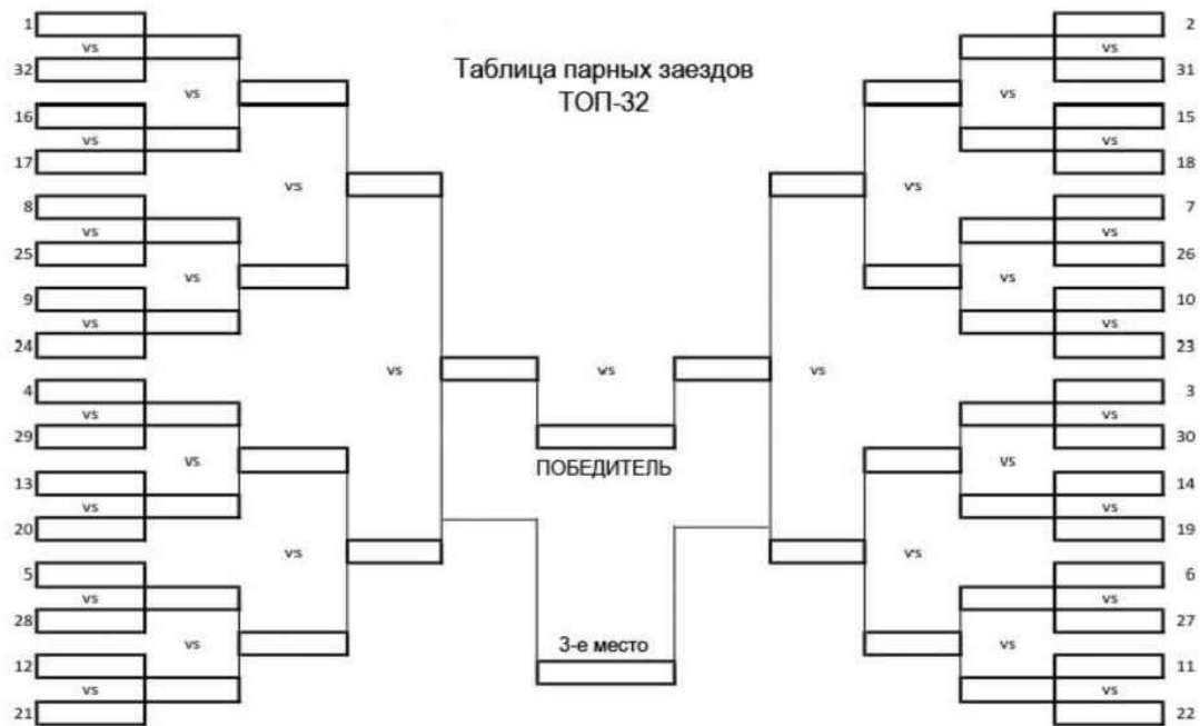
СХЕМА ПРОВЕДЕНИЯ ПАРНЫХ ЗАЕЗДОВ